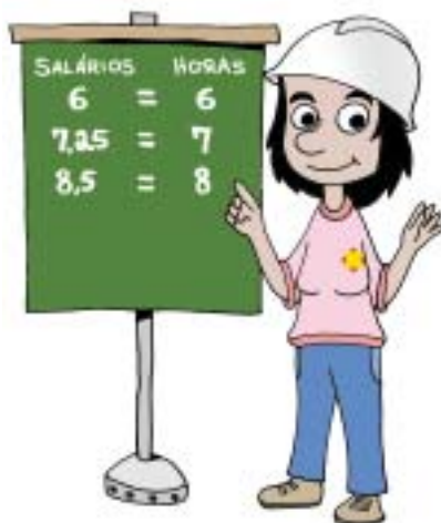
Tabela para cálculo do Salário Mínimo Profissional com acréscimo de 25%

Acima da jornada de 8 horas diárias é considerada hora extra que deverá ser remunerada com o adicional de 50%.